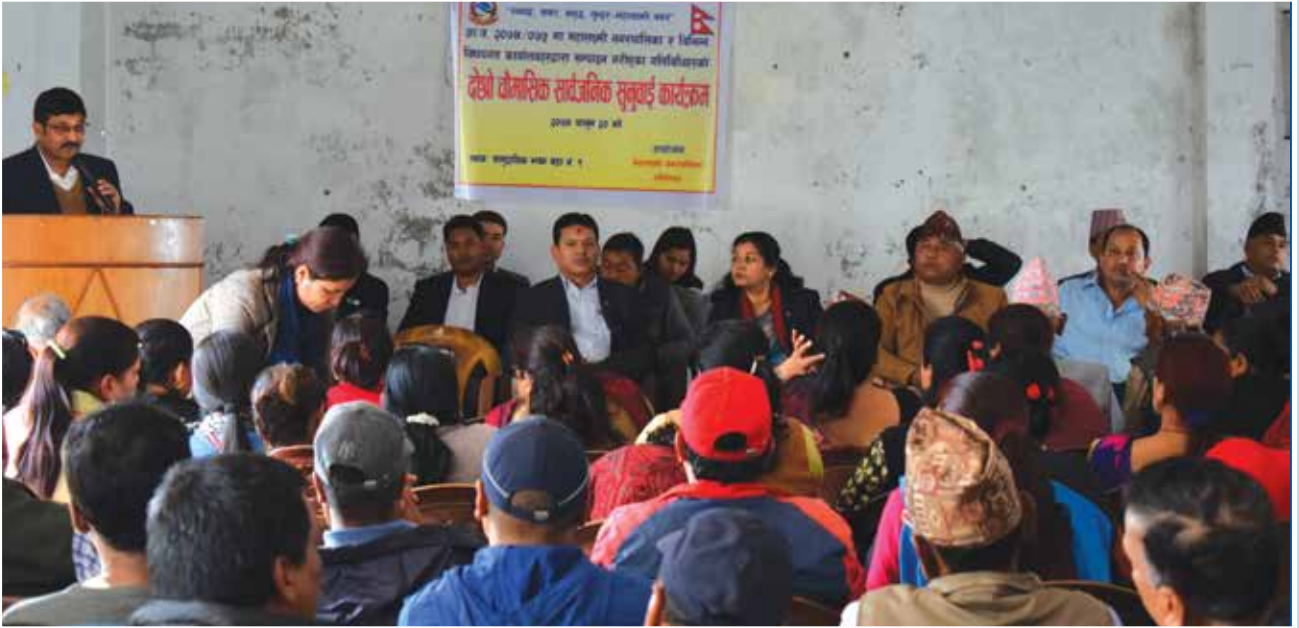
दोस्रो चौमासिक सार्वजनिक सुनुवाई कार्यक्रम ।