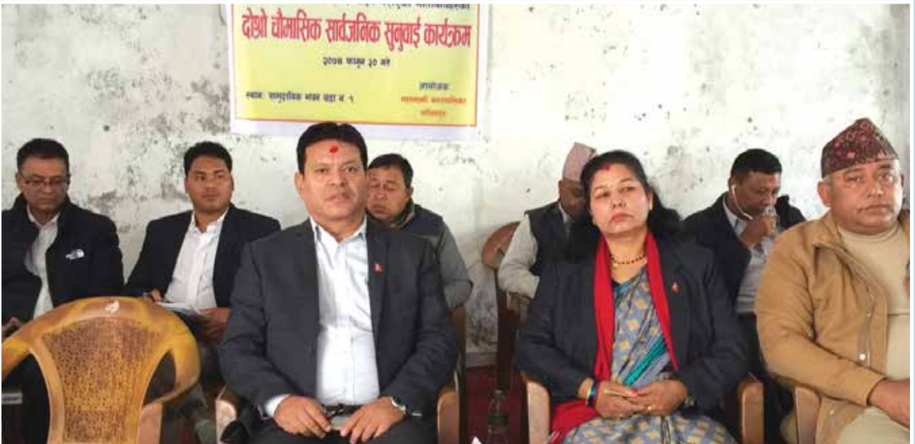
महालक्ष्मी नगर पर्यटन विकास अन्तर्क्रिया कार्यक्रम ।