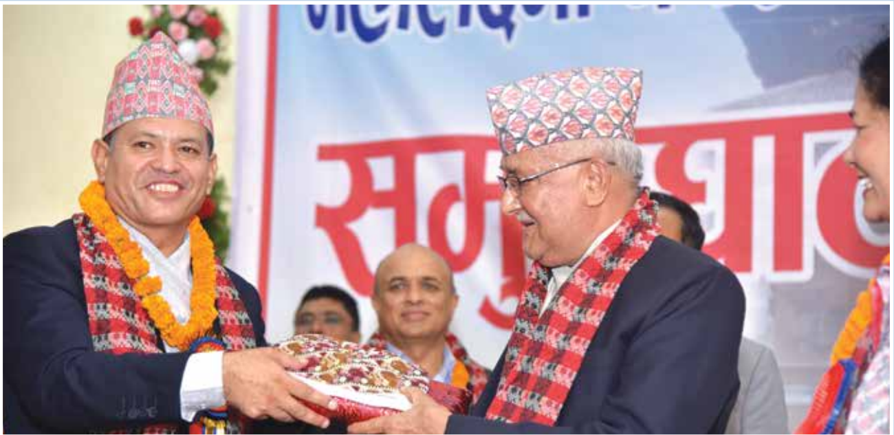
प्रथम नगरसभा उद्घाटन कार्यक्रममा प्रधानमन्त्री केपी शर्मा ओलीलाई मायाको चिनो प्रदान गर्दै मेयर ।