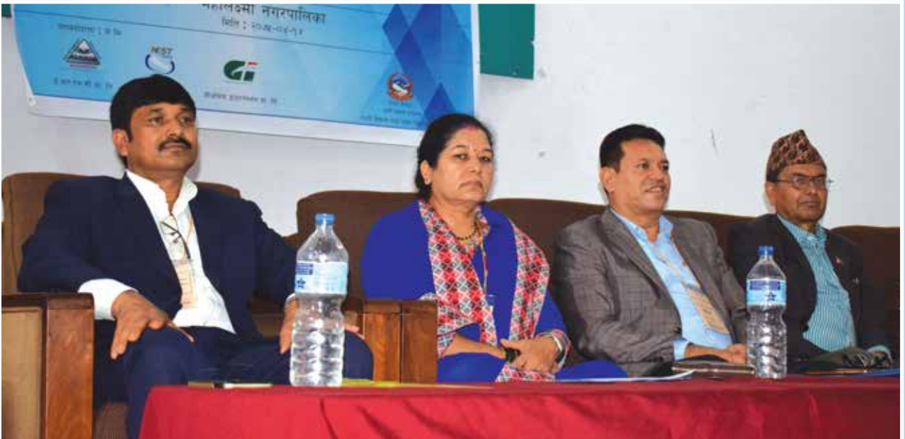
सहरी विकास योजना सम्बन्धी कार्यशाला गोष्ठी ।