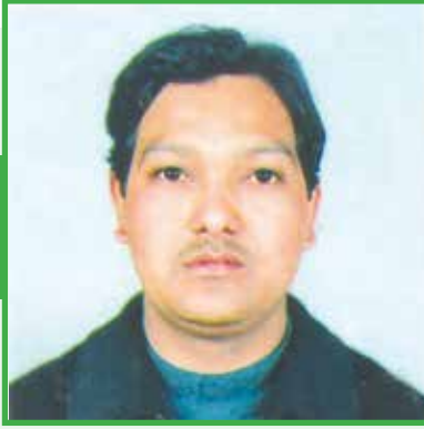
वडा अध्यक्षको अनुभव