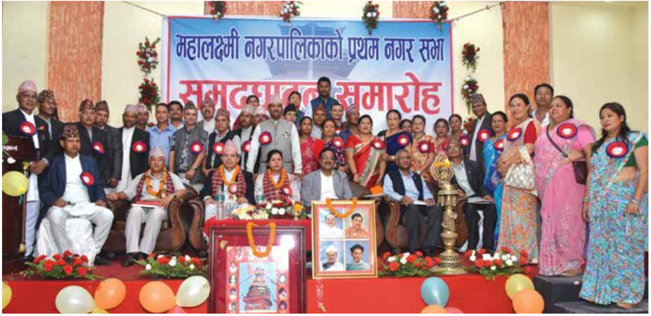
प्रथम नगरसभा उद्घाटन कार्यक्रम ।