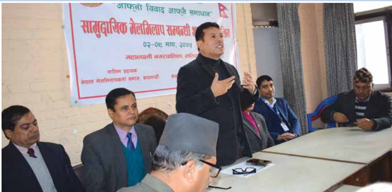
सामुदायिक मेलमिलाप कार्यक्रममा सहभागी ।