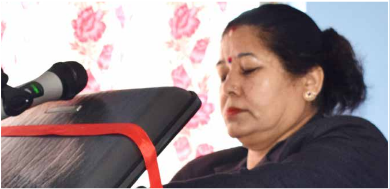
बजेट प्रस्तुत गर्दै उपप्रमुख ।