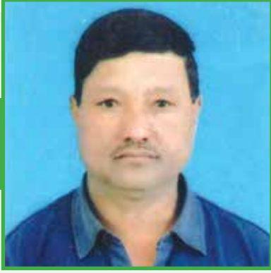
वडा अध्यक्षको अनुभव