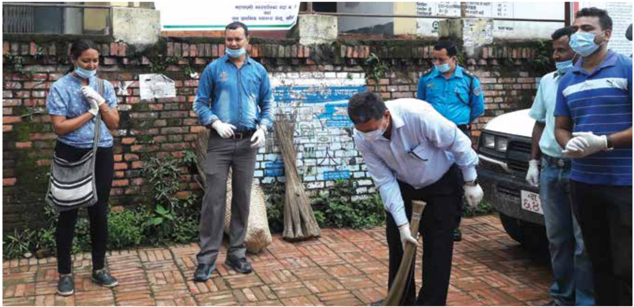
लुभुमा भएको सरफाई कार्यक्रम ।