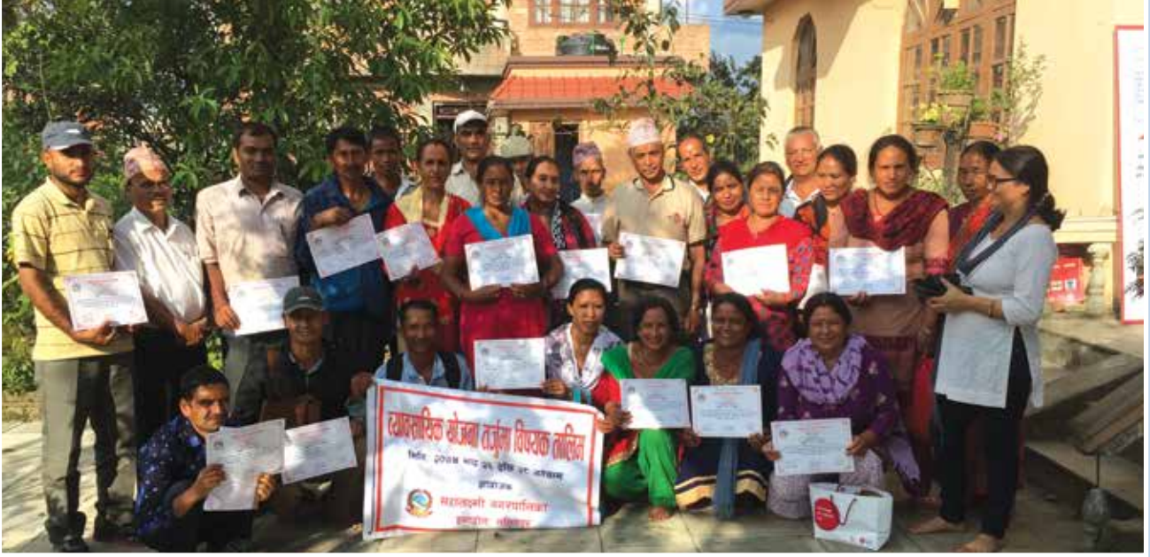
व्यवसायिक योजना तर्जुमा तालिम ।