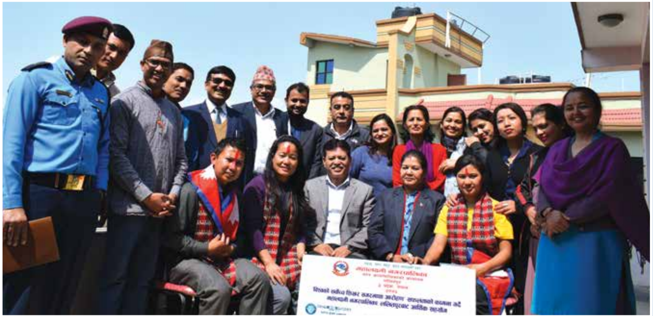
सगरमाथा आरोहीलाई आर्थिक सहयोग गरेपछि ।