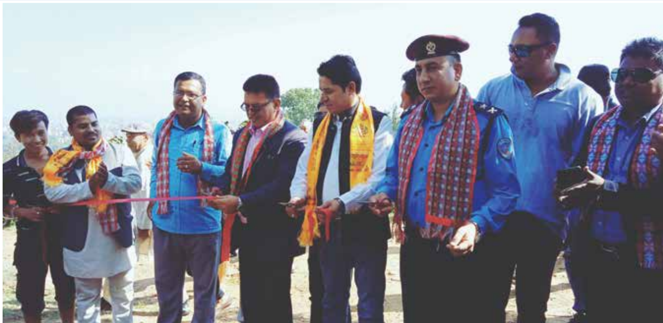
लामाटारबाट हामी सबैको यातायात बस सञ्चालन गर्दै ।