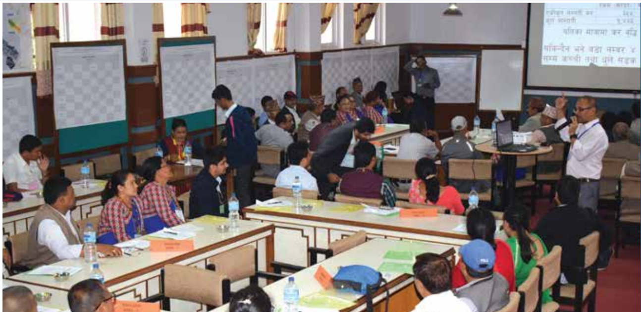
तालिम कार्यक्रम ।