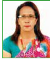
गंगा दाहाल महिला सदस्य - २