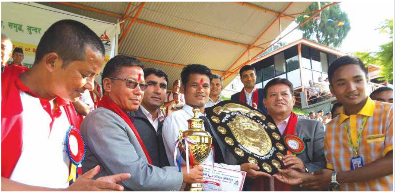
राष्ट्रपति रनिड शिल्ड प्रदान गर्दै मेयर ।