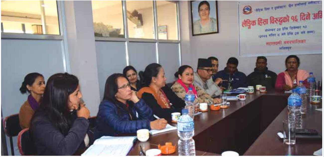
लैङ्गिक हिंसाविरुद्धको १६ दिने अभियानमा भएको कार्यक्रममा सहभागीहरू ।