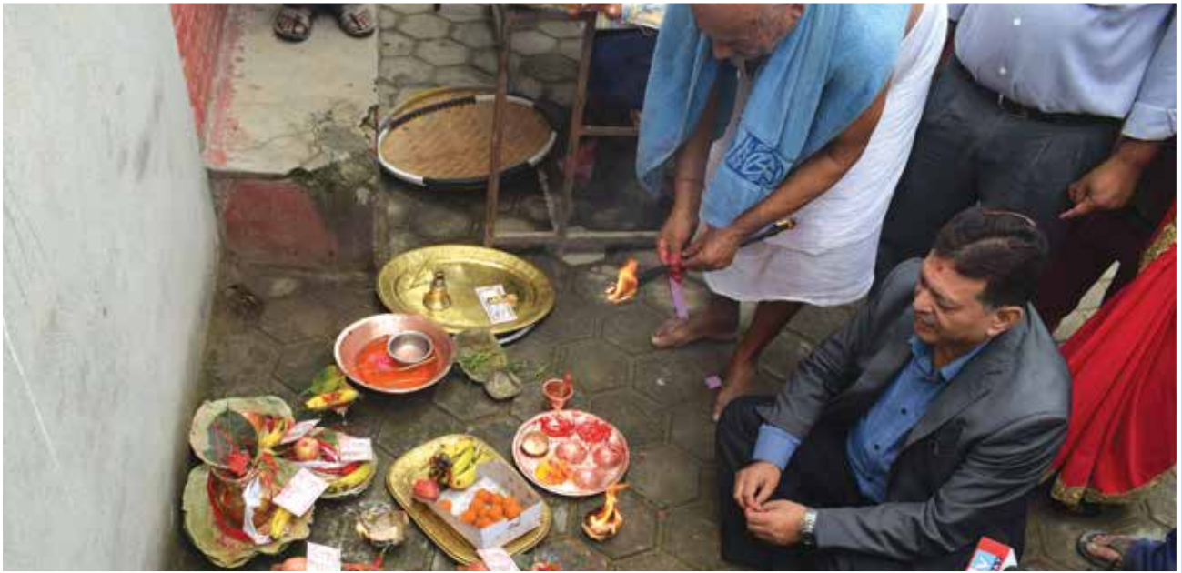
वडा नम्बर ७ भवन शिलान्यास कार्यक्रम ।