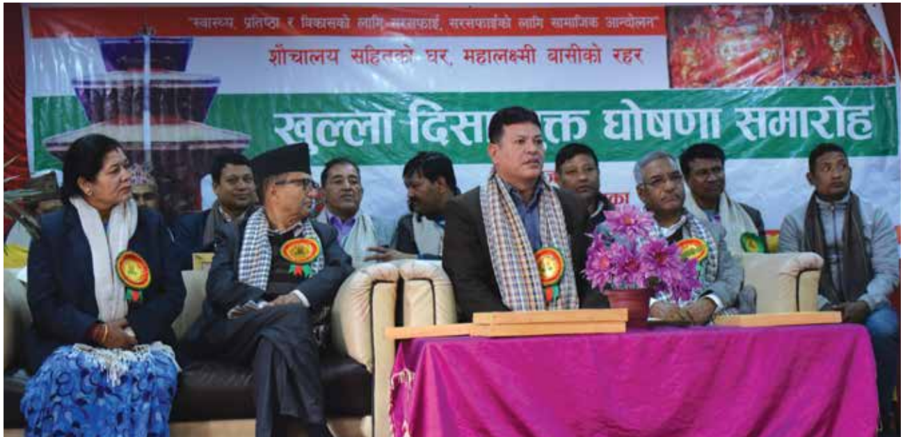
खुला दिसामुक्त घोषणा कार्यक्रम ।