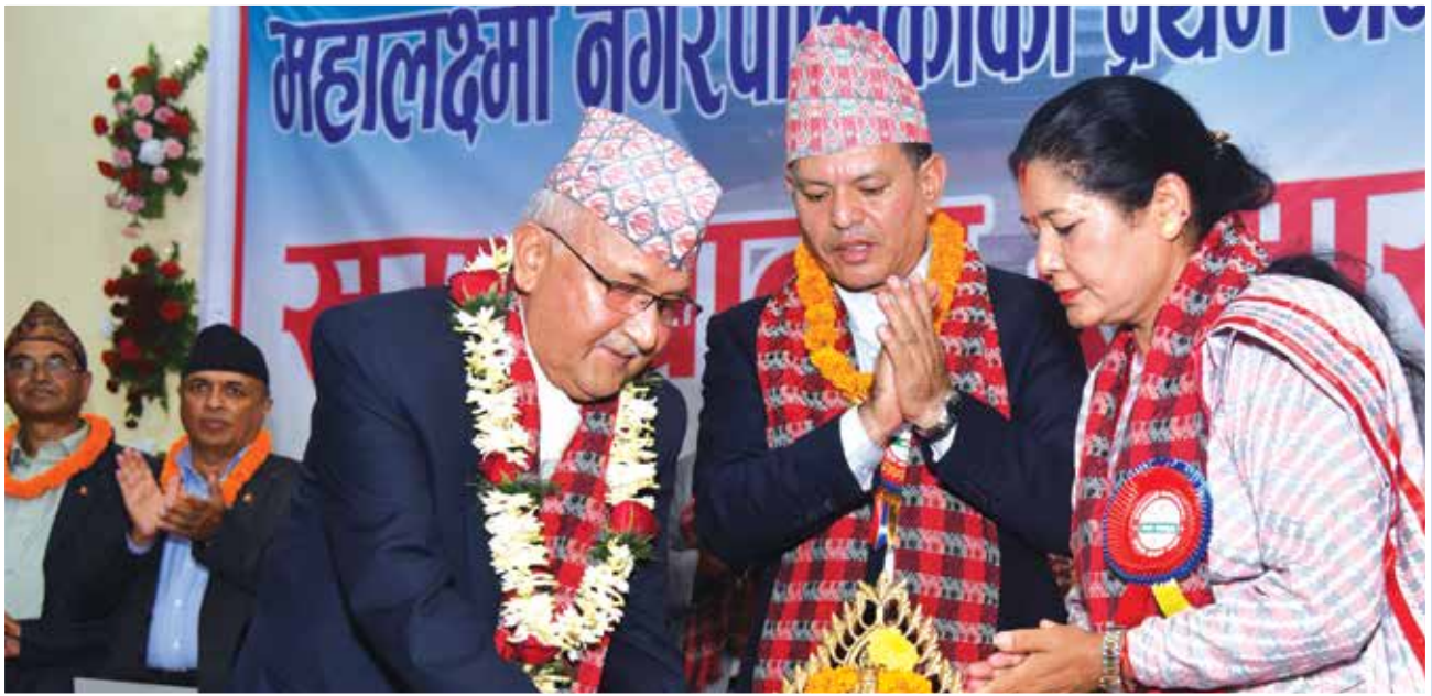
प्रथम नगरसभा उद्घाटन कार्यक्रममा प्रधानमन्त्री केपी शर्मा ओली ।