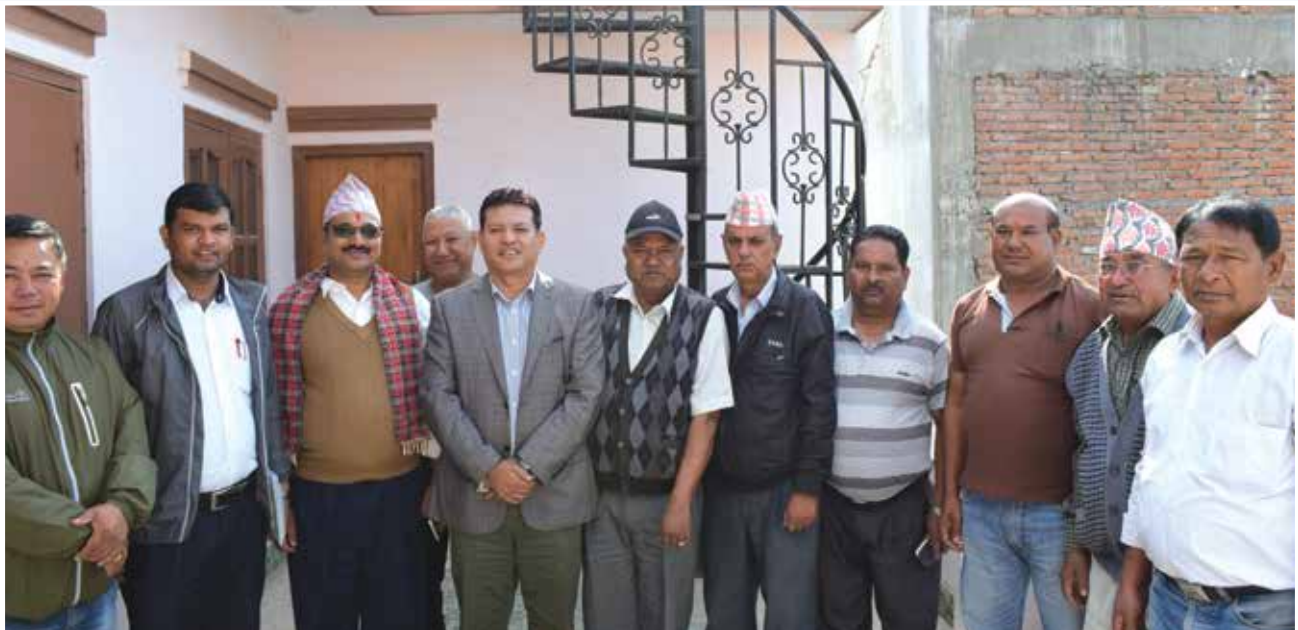
यातायात व्यवसायी सँगको छलफल ।