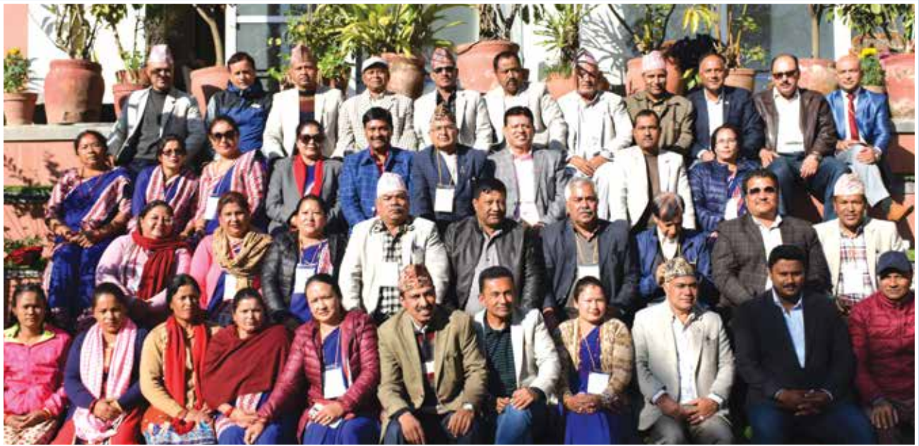
धुलिखेलमा भएको कार्यक्रमपछि ।