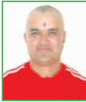
कुवेर के.सी. वडा अध्यक्ष - ३