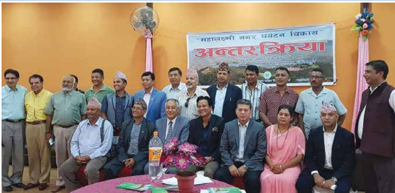
राष्ट्रपति रनिङ शिल्ड खेलकुद कार्यक्रम ।