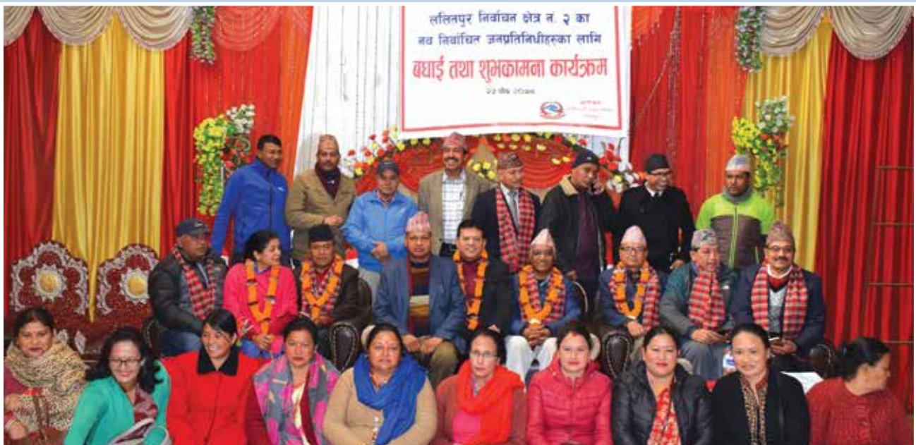
प्रतिनिधिसभा र प्रदेशसभामा निर्वाचितको सम्मान कार्यक्रम ।